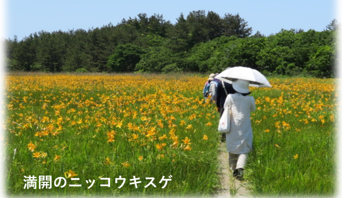
満開のニコウキスゲ