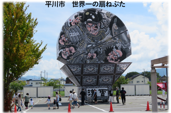
平川市 世界一の扇ねぶた